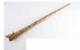
Sunpriñua: hurritz azala